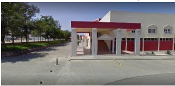
Pavilhão Municipal do Bombarral

12.1. Os balneários no pavilhão municipal, estarão disponíveis para os atletas assim que se iniciar o evento.